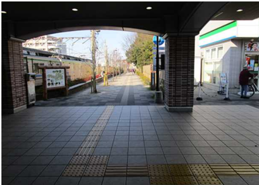
"Unga" station, East exit 運河駅東口