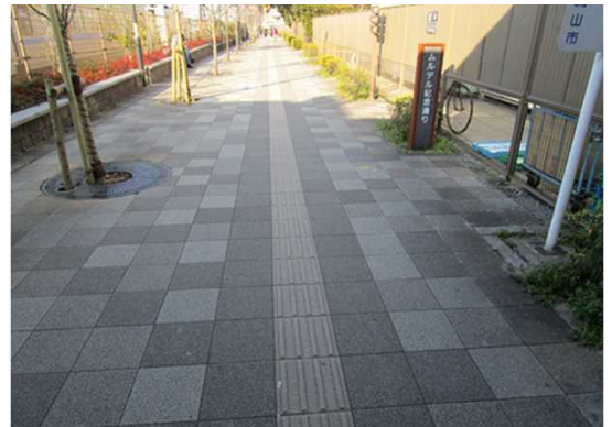
Please walk along on this "Mulder street" ムルデル記念通り