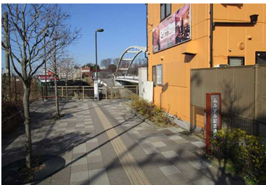
Turn right at this corner ここを右へ曲がってください。