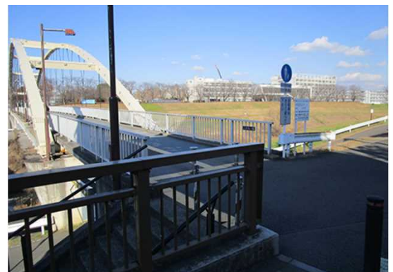
Please walk across "Fureai Bridge". ふれあい橋を渡ってください。